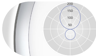
OPAL DIFFUSER | DIRECT-INDIRECT