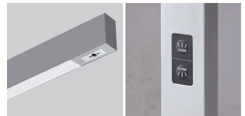
MULTISENSOR DAYLIGHT & PRESENCE