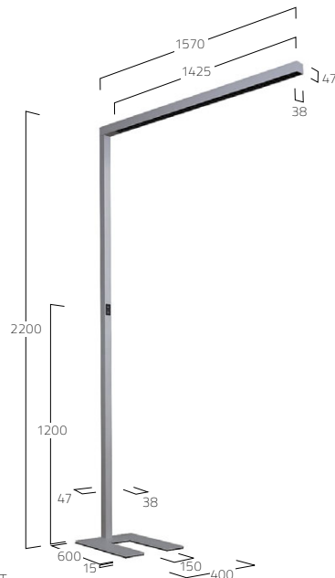
LENS LOUVER | DIRECT-INDIRECT

FR Lampe de bureau LED. Éclairage direct/indirect. Corps du luminaire en profilé aluminium. Surface laquée blanc, argent, graphite, noir, champagne ou cuivre. Autres options de finition voir Lightnet-Surface-Collection ou RAL au choix. Éclairage direct partiel par lentilles de précision avec grille antiéblouissement pour une large répartition symétrique de l'intensité lumineuse et facteur d'antiéblouissement très bas (UGR<16). Grille antiéblouissement disponible en plusieurs combinaisons de couleurs. Commande intuitive sur le mât du luminaire pour une graduation séparée l'allumage Direct et Indirect, alternative de gestion groupée au travers de la technologie moderne de sensor/cellule ou swarm control. Pied du luminaire en forme de U rectangulaire ou découpe latérale Side-Cut-Out pour différents modèles de bureaux et applications, couleur au choix adaptée au corps du luminaire.